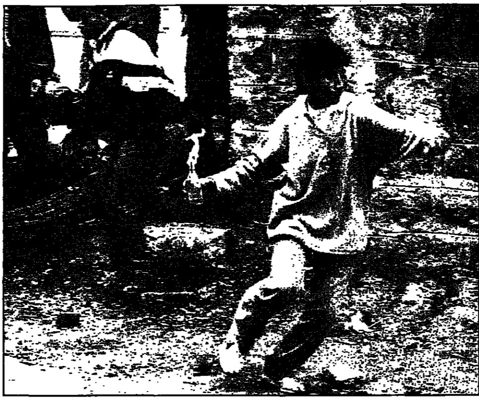
مسي فلسطيني يرمي زجاجة حارقة على جنود إسرائيليين أثناء مظاهرات في مدينة القدس